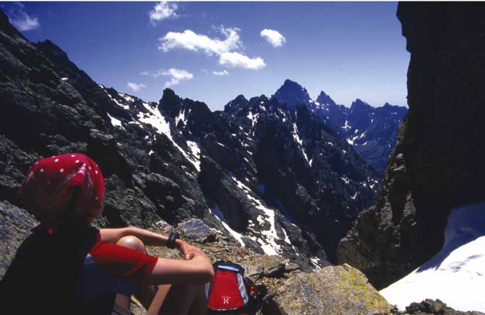
Col Perdu, Corse

HAGLÖFS DEUTSCHLAND GMBH Albert-Einstein-Straße 6 87437 Kempten info@haglofs.de