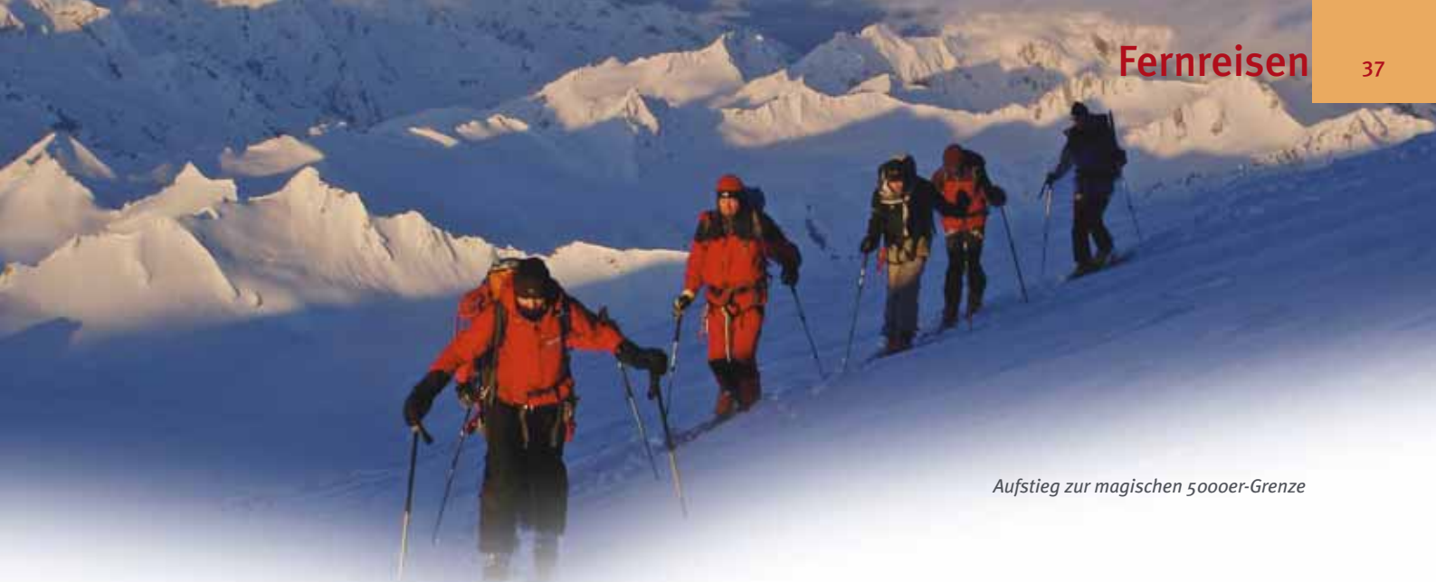
Aufstieg zur magischen 5000er-Grenze