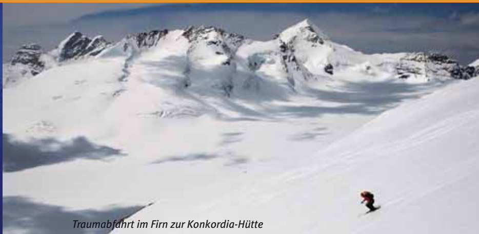
Traumabfahrt im Firn zur Konkordia-Hütte