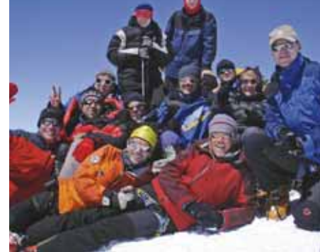
Elbrus, 5642 m