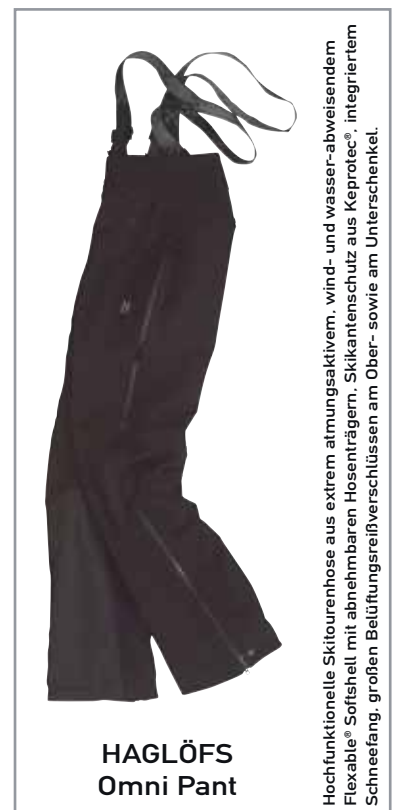
HAGLÖFS Omni Pant

Hochfunktionelle Skitourenhose aus extrem atmungsaktivem, wind- und wasser-abweisendem Flexible® Softshell mit abnehmbaren Hosenträgern. Skikantenschutz aus Keprotec®, integriertem Schneefang, großen Belüftungsrißverschlüssen am Ober- sowie am Unterschenkel.