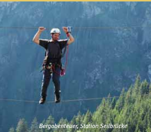
Bergabenteuer, Station Seilbrücke