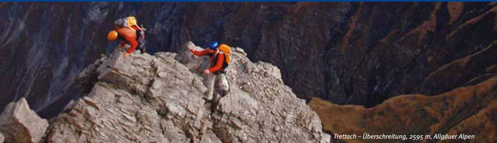
Trettach – Überschreitung, 2595 m, Allgäuer Alpen