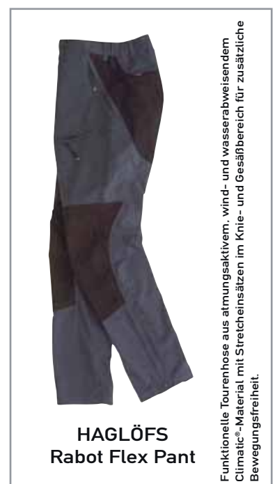
HAGLÖFS Rabot Flex Pant

Tel: 08324/ 95 36 50 Fax: 08324/ 95 36 51 info@bergschulen.de www.bergschulen.de