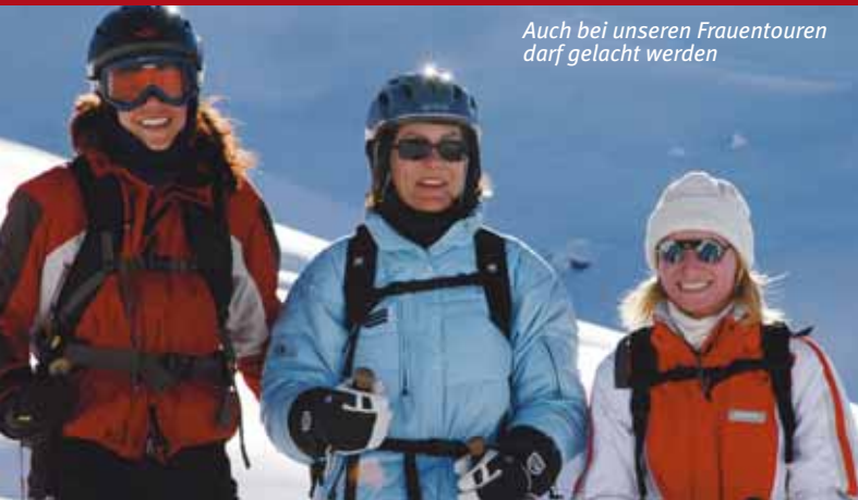
Auch bei unseren Frauentouren darf gelacht werden