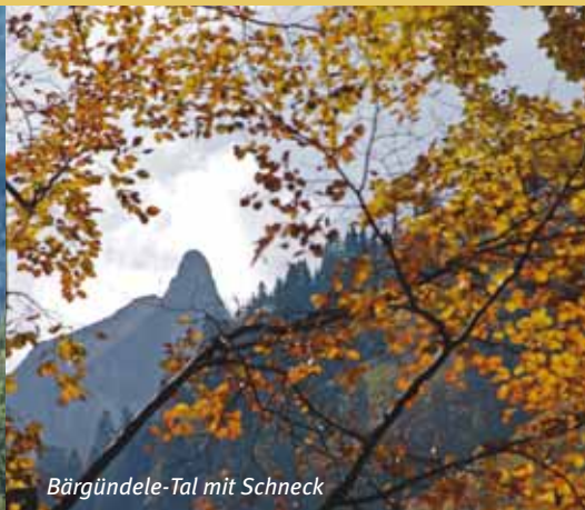
Bärgündele-Tal mit Schneck