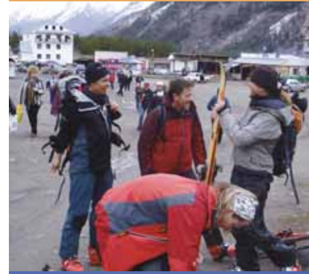
Erfolgreiche Gipfelbesteigung 2006