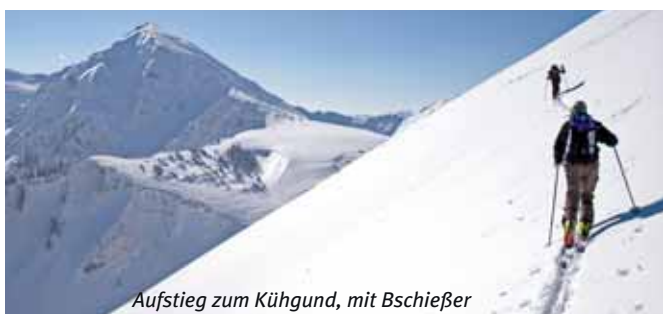
Aufstieg zum Kühgund, mit Bschießer

Mittwoch: Geführte Schneeschuhwanderung im Ostrachtal Preis: EUR 23,- pro Person (inkl. Leihhausrüstung)