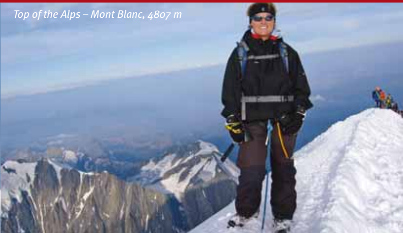
Top of the Alps – Mont Blanc, 4807 m