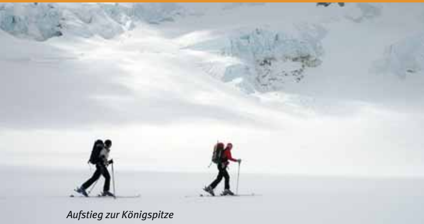
Aufstieg zur Königspitze