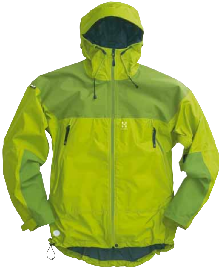
HAGLÖFS Fusion Jacket

Qualität, Funktionalität und ansprechende Optik sind für die Hindelanger Bergführer die Kriterien, um sich für die HAGLÖFS FUSION JACKET zu entscheiden