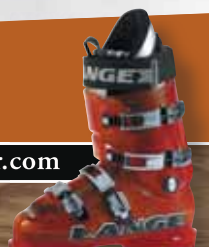
LANGE FREERIDE 120