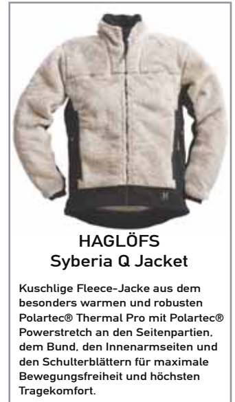
HAGLÖFS Syberia Q Jacket

Leistungen: 3 Tage Organisation, Ausbildung und Führung durch einen Bergführer; 2 x ÜHP auf der genannten Hütte; Leihhausrüstung wenn nötig Preis/Pers: € 265,- Im Preis nicht enthalten: Mittagsverpflegung und Marschtee, Transfer Teilnehmerzahl: mind. 2/max. 4 Pers. pro Führer