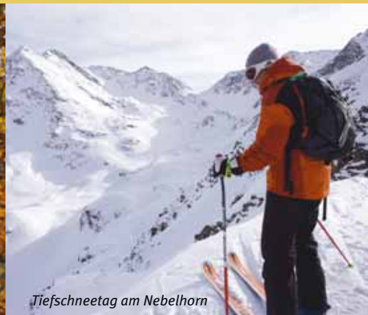
Tiefschneetag am Nebelhorn