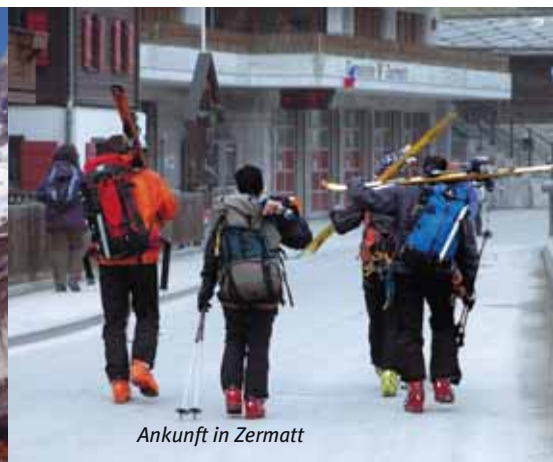
Ankunft in Zermatt