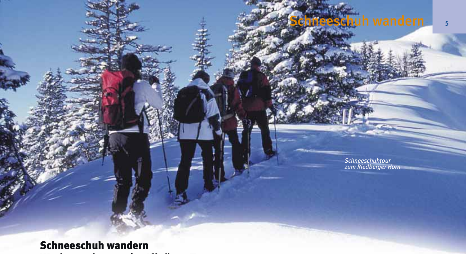
Schneeschuhtour zum Riedberger Horn